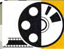
IMAGEN Y SONIDO